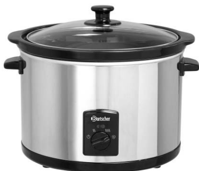
A100155 / 5,5L