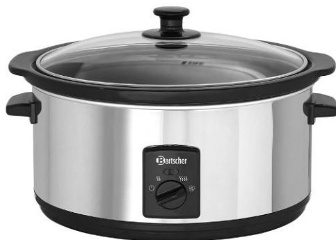
A100265 / 6,5L